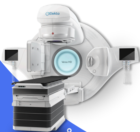
acelerador linear de radioterapia